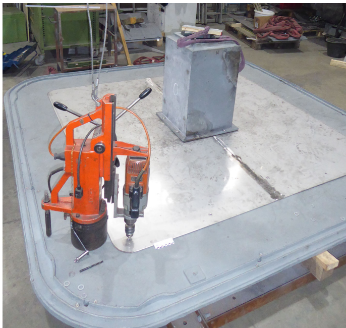
Vorbohren der Edelstahlplatte

Die Gemeinde wird regelmäßig mit Fotos über den Reparaturfortschritt des oberen Dorfbrunnens auf dem Laufenden gehalten. Vielleicht sind diese auch für die Bürger/innen ganz interessant: