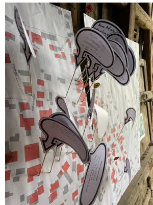
Zahlreiche Markierungen zu Bernbeurens Ortsentwicklung