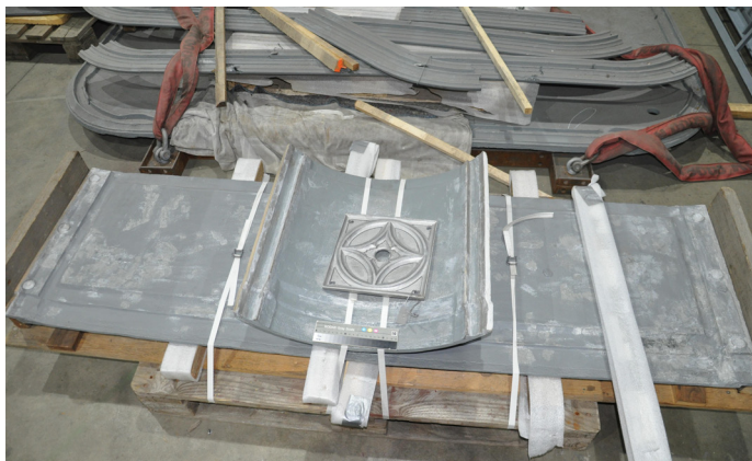
Kittungen der Einzelteile