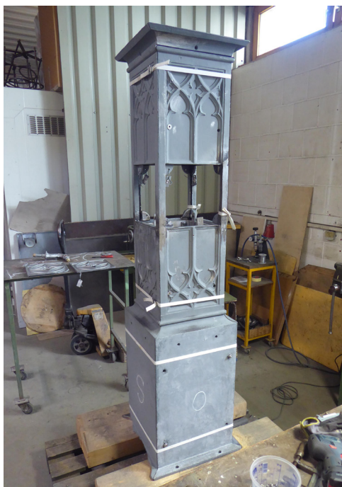
Der Stock in der Mitte des Brunnens