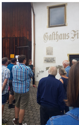
Der Vortrag zum ehemaligen Richterhaus