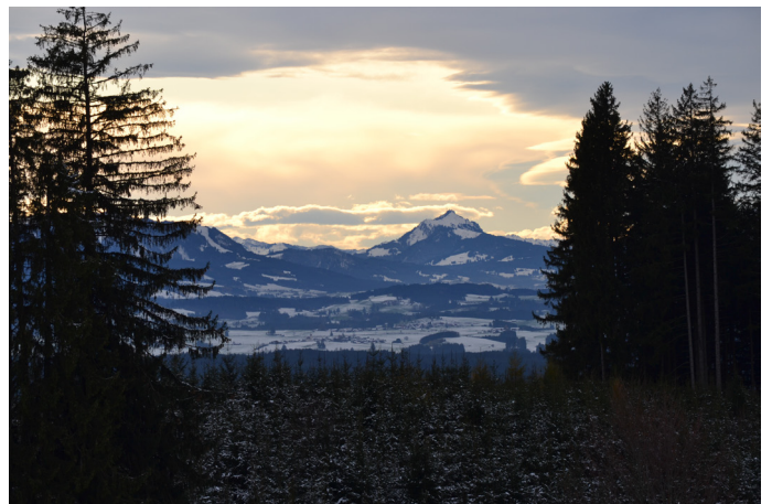
Blick vom Auerberg Richtung Grünten