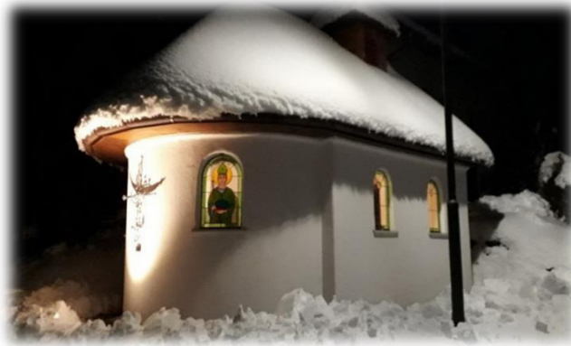
Kapelle zur Heiligen Familie, Lange Gasse