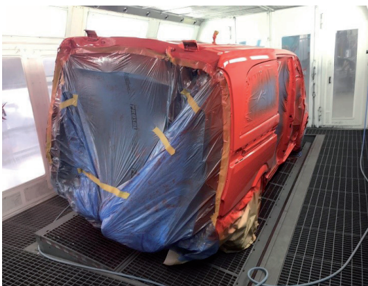
Der Bus während des Umlackierens bei der Firma Keller von Hibiskusrot hin zum Original Feuerwehrrot

Mitte Juni, als die ersten Corona Lockerungen kamen und wir in kleinen Gruppen auch wieder in der Feuerwehr sein durften, machten wir dann weiter mit dem Ausbau und konnten sämtliche Arbeiten Ende Juli erfolgreich beenden.