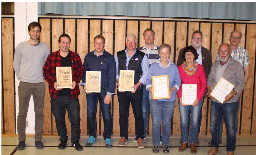
Geehrte Mitglieder 2019