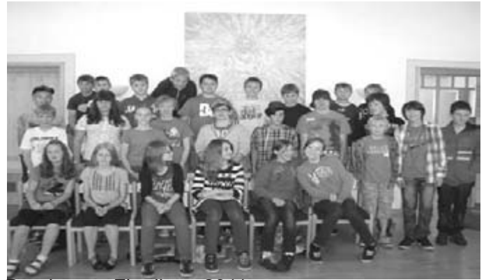
Bernbeurer Firmlinge 2011

Die Firmung der Pfarreiengemeinschaft Burggen mit Domkapitular Franz-Reinhard Daffner findet am 13. Juli 2011 um 10.00 Uhr in Burggen statt.